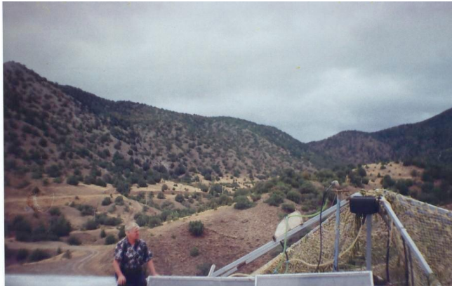
Монтаж солнечных нагревателей воды в столовой турбазы в районе посёлка Новый свет

Солнечная котельная пансионата „Полимер” (ПГТ Николаевка). Площадь гелиосистемы- 49 кв. м, дневная производительность-5-7 куб. м горячей воды